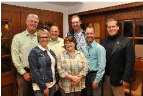
Für unser Dorf aktiv — der Vorstand: